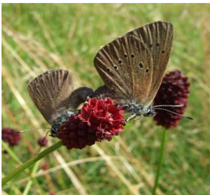
Alexanda Schuster, piclease.de

Die Sicherung und Pflege extensiv genutzten Grünlandes für den gefährdeten Dunklen Wiesenknopf-Ameisenbläuling ist ein Ziel des Projektes. Gleichzeitig dient es aber auch durch die Anlage eines Tümpel einer kleinen Laub-froschpopulation als Zuhause. Wie bereits in den anderen oben beschriebene Projekten ist auch hier die Stiftung Grundeigentümer, die Betreuung vor Ort wird vom AK Darmstadt-Dieburg der HGON, der auch Initiator des Gesamtprojekts war, übernommen. Im Berichtsjahr wurde keine finanzielle Unterstützung benötigt, sodass die Mittel in die anderen Projekte der Stiftung fließen konnten.